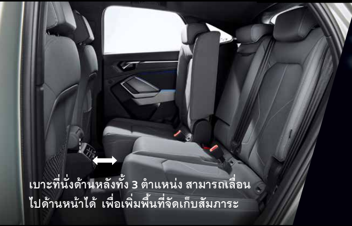
เบาะที่นั่งด้านหลังทั้ง 3 ตำแหน่ง สามารถเลื่อนไปด้านหน้าได้ เพื่อเพิ่มพื้นที่จัดเก็บสัมภาระ