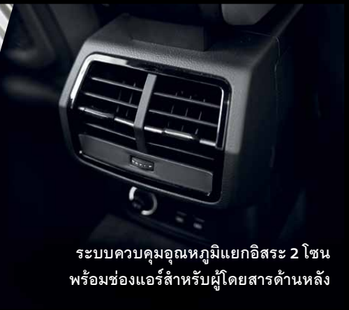
ระบบควบคุมอุณหภูมิแยกอิสระ 2 โซน พร้อมช่องแอร์สำหรับผู้โดยสารด้านหลัง