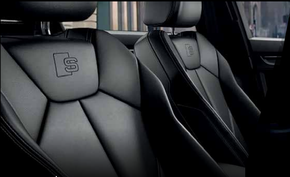
เบาะนั่งคู่หน้าแบบ Sports พร้อมสัญลักษณ์ S line