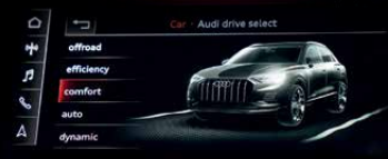
ระบบเลือกโหมดการขับขี่ (Audi drive select)