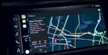
สามารถใช้ระบบนำทางผ่าน Google Maps จาก Apple CarPlay ได้