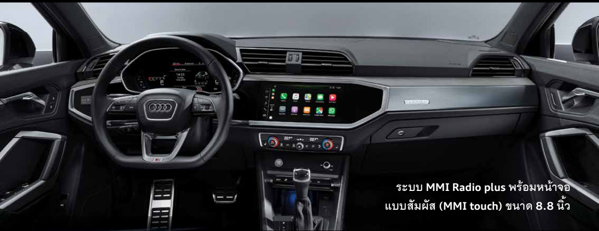
ระบบ MMI Radio plus พร้อมหน้าจอแบบสัมผัส (MMI touch) ขนาด 8.8 นิ้ว