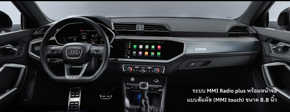
ระบบ MMI Radio plus พร้อมหน้าจอแบบสัมผัส (MMI touch) ขนาด 8.8 นิ้ว