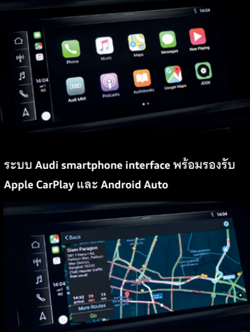
สามารถใช้ระบบนำทางผ่าน Google Maps จาก Apple CarPlay ได้