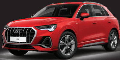
Q3 35 TFSI S line

ตัวถังขยายใหญ่ขึ้นทุกมิติส่งผลให้พื้นที่ห้องโดยสารกว้างขวางสะดวกสบาย