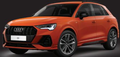
Q3 40 TFSI quattro S line Black Edition