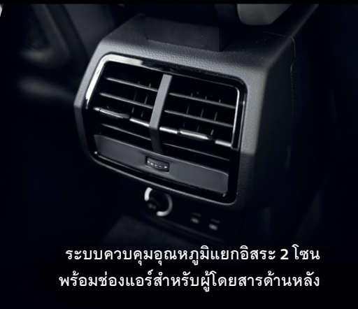
ระบบควบคุมอุณหภูมิแยกอิสระ 2 โซน พร้อมช่องแอร์สำหรับผู้โดยสารด้านหลัง