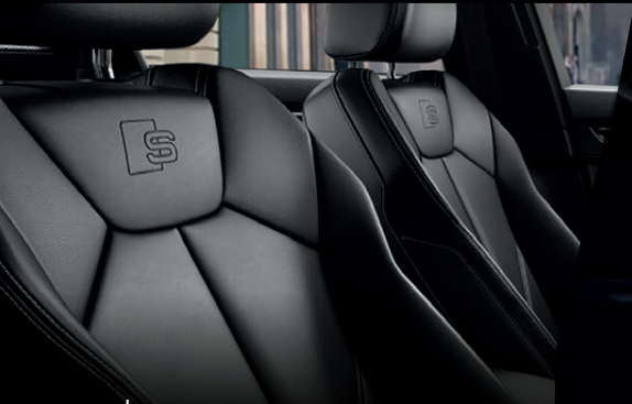
เบาะนั่งคู่หน้าแบบ Sports พร้อมสัญลักษณ์ S line*