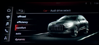
ระบบเลือกโหมดการขับขี่ (Audi drive select)