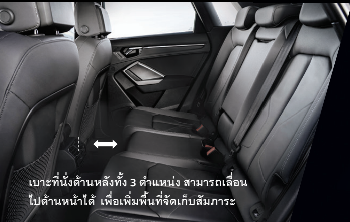
เบาะที่นั่งด้านหลังทั้ง 3 ตำแหน่ง สามารถเลื่อนไปด้านหน้าได้ เพื่อเพิ่มพื้นที่จัดเก็บสัมภาระ