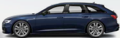
Firmament blue, metallic (5U5U)