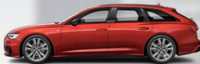
Grenadine red, metallic (S5S5)