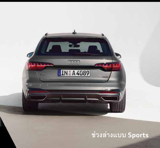
ช่วงล่างแบบ Sports