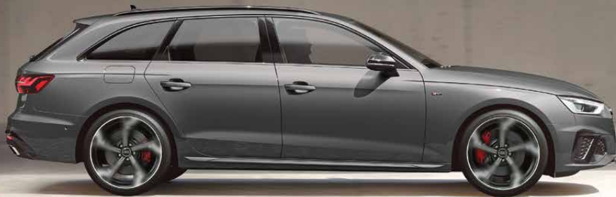
ชุดตกแต่งภายนอกแบบ S line และ Black Edition