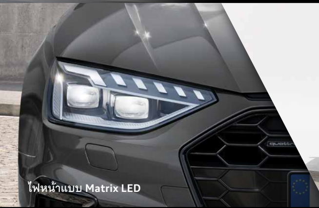
ไฟหน้าแบบ Matrix LED