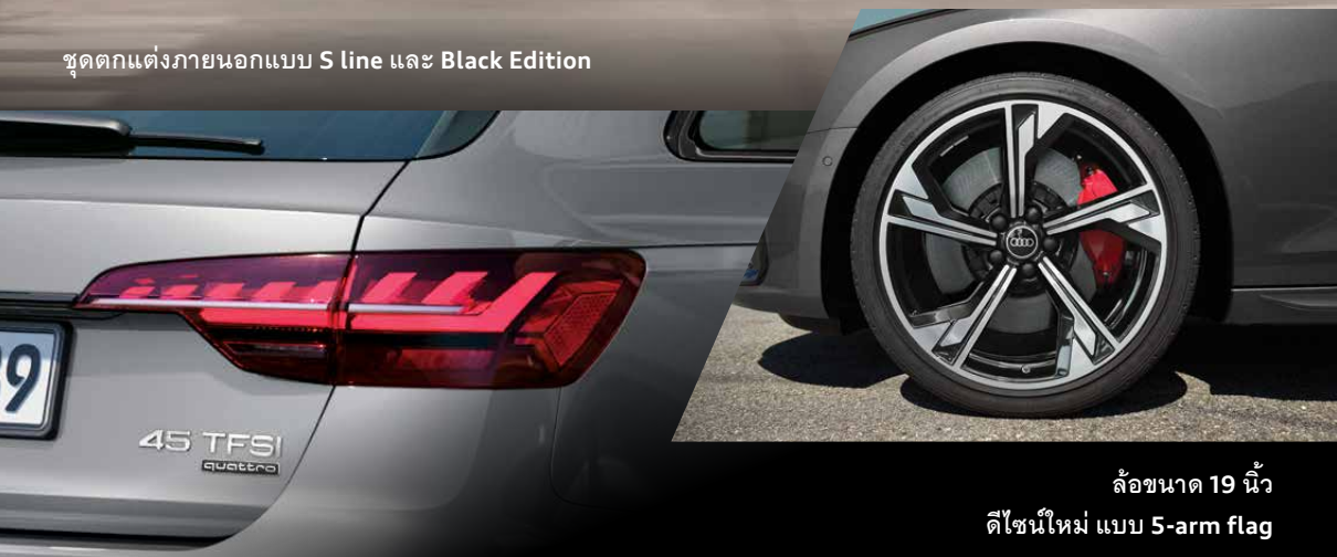
ล้อขนาด 19 นิ้ว