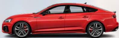
Progressive red, metallic (B1B1)