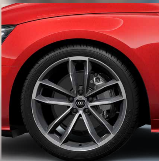
19 inch 5-Cavo-spoke rims