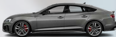
Chronos grey, metallic (Z7Z7)