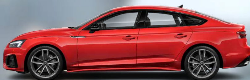
S line Black Edition