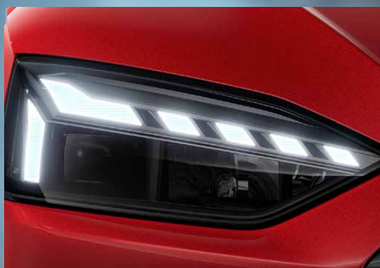
Matrix LED headlight