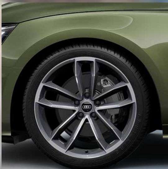
19 inch 5-Cavo-spoke rims