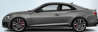
Chronos grey, metallic (Z7Z7)