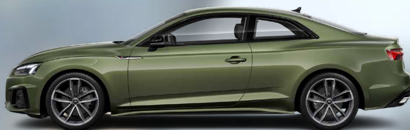
S line Black Edition