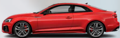
Progressive red, metallic (B1B1)