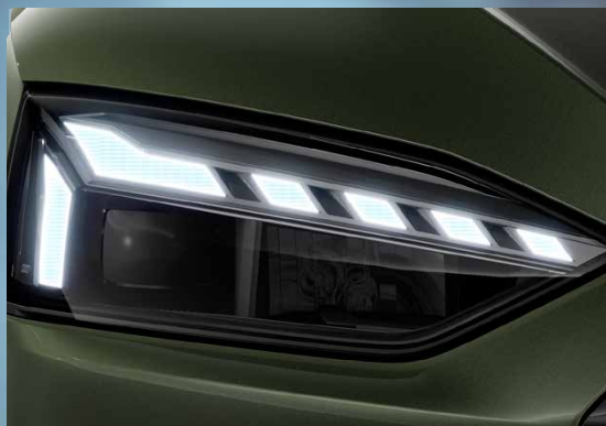
Matrix LED headlight